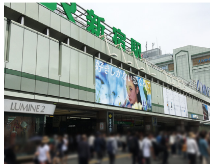
Shinjuku station South Entrance (Exit)